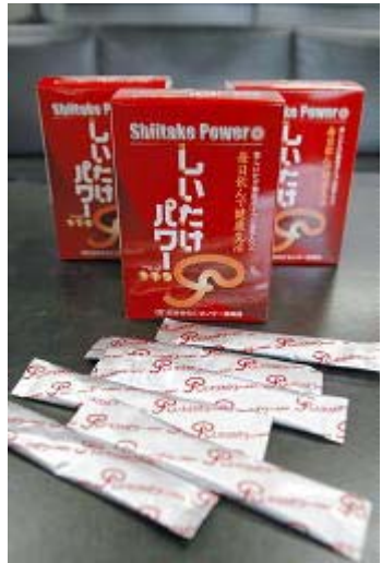
菌興椎茸協同組合が10日から販売する健康補助食品「しいたけパワー115」